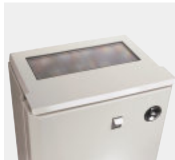
Solarmodul für optimale Stromversorgung im Außenbereich