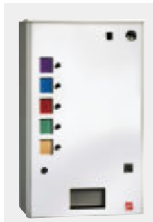
SG 5000 SO